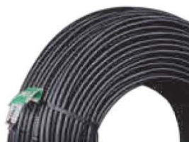
iMULTIBAR C dripline