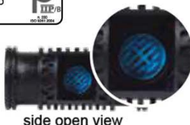
side open view